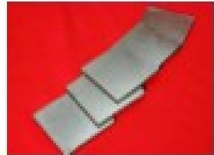
パイロイド® PGプレート

Trent 1000