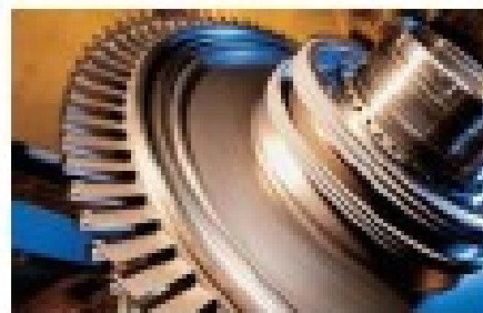
恒温鍛造の航空宇宙用合金ディスク (United Technologies/Pratt&Whitney)